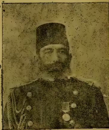
اختلال عسکریدن صکره حربیه نظارتمه تعین اولنان مشیر ادهم پاشا

طاغیتدم . عصیانى باشلادیغى صرهدده باصدیرمق چوجق او یونجاغى قبیلندن برشى ایدی . حرکات شدتکارانده بولمقلغمه قصداً مانعت ایدلدیکندن عصیان کیتدکجه توسیع دائره ایتدی ، «عسکره پادشاه طرفندن عفو عمومی اعلان ایدیلنججه وظیفهم استعفا ایتمکدی . چونکه بن وحشی سورولرینه دکل ، عسکره قوماندا ایتمکه مأمورم . خاصه اردوسنده بوقدر سعی وغیرت وتعلیم نتیجه سنده حاصل اولان موفقیات عظیمه نك برضربه ده محو اولدیغنه پك مایوسم . ارباب اختلاله بوقدر جسارت ویرن جهت پادشاه طرفندن حرکات تخریبکارانه لرینك خوش کوروله جکسنگ